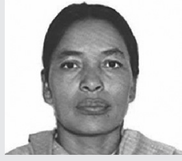
● मनु वि.क. ●

निर्वाचन बहिष्कारको पहिलो चरणको कार्यक्रम अन्तर्गत पुस २५ गते उपत्यका बन्द कार्यक्रम आयोजना भएको थियो । उपत्यका बन्द कार्यक्रमको पूर्वसंध्यामा पुस २८ गते काठमाण्डौंको विभिन्न स्थानमा मसाल जुलुसको आयोजना गर्ने निर्णय भएको रहेछ र पार्टीहरूले विभिन्न स्थानमा एकल वा संयुक्त रूपमा नेतृत्व गर्ने निर्णय भएको रहेछ ।