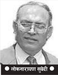
● लोकनारायण सुबेदी ●

दक्षिण अफ्रिकाको इतिहासमा काला जातिको पहिलो राष्ट्रपति निर्वाचित भएको एक कार्यकालपछि नै उनी सत्ता केन्द्रबाट बाहिरिएर त्यसपछि सक्रिय राजनीतिमा आफूलाई अगाडि सारेनन् । उमेरका कारणले समेत उनी पछि सरेर नया पुस्तालाई सहज किसिमले सत्ता हस्तान्तरण गरे । जुन आजको सत्तामुखी विश्व राजनीतिमा अत्यन्तै सराहनीय र प्रसंशनीय मात्रै होइन अत्यन्तै प्रेरणास्पद, अनुकरणीय दुर्लभ कार्य पनि हो