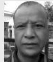
● कृषाभक्त महर्जन 'कगोर'

अमन चैन नहुने जिन्दगी सुख शान्ति नहुने जिन्दगी के काम छ र जिन्दगीको के भरोसा छ र जिन्दगीको