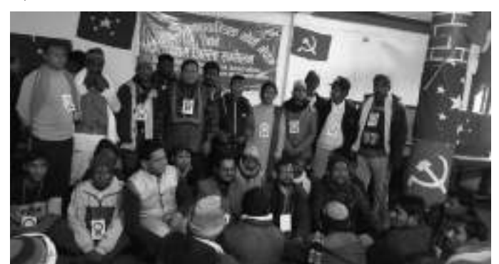
बुटवल । नेकपा (क्रान्तिकारी माओवादी) समर्थित देशभक्त जनगणतान्त्रिक मोर्चा-नेपाल ५ नं. प्रदेश सम्मेलनको भव्य तयारीमा जुटेको छ । चैत्रको ५ र ६ गतेका लागि राखिएको प्रदेशसम्मेलनलाई ... बाँकी ८ पेजमा