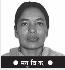
● मनु वि.क. ●

सबै समस्या र विभेदहरू सकिएको छ त ? दलित समुदाय तीन हजारपैतिस सय वर्षदेखि उत्पीडन सहँदै आएको समुदाय हो । यो समुदाय समाजमा आर्थिक रूपमा उच्च जातीय समुदाय भन्दा पछाडि पारिएको समुदाय हो । यो समुदायको काँधमा टेकेर आजका साहु,महाजनहरू, धनी, उच्च बन्ने मौका पाए । राज्यले कानुन बनाएर दलित समुदायमाथि उत्पीडन गर्दै आयो । दूला जातिहरूको सेवा गर्नु भन्दै नियमहरू बनाए । खास भन्ने हो भने जन्मकै आधारमा उत्पीडित समुदायको हातको पानीसम्म चलेको छैन । आज पनि घर,समाजले दलित जातिलाई मान्नेको रूपमा नै व्यवहार गर्दैन । दलित हो, मलाई कोठा दिनु त,भनेर भन्ने हो भने आज पनि कोठा पाउन नसक्ने स्थिति दलितको छ । आर्थिक रूपमा कमजोर, सामाजिक रूपमा बहिस्कृत,अछुत जाति राज्यको पहुँचको हिसाबले पहुँचबाट टाढा,शैक्षिक हिसाबले शिक्षा लिनबाट वञ्चित,समाजले राज्यले मान्नेको रूपमा नै अहिलेसम्म पनि लिन नसकेको समुदाय हो । समाजले उनीहरूलाई सिधै अछुत बनायो । समाजले उनीहरूलाई छिछ, दूरदूर गरेर राख्यो । उनीहरूको पसिना श्रम सिधै खोसेर खायो । माथिल्ला बनाएका जातिको सेवा गर्नु भन्दै सेवामा खटायो । विगतमा धारा, कुवा, पाँधेरा, पाटी, पौवा,कुवा, गुरुकुल स्कुल सबैबाट टाढा रहनु पर्छ भन्दै राख्यो । दलितहरूबाट उच्च जातिहरू टाढा रहे दलितहरूलाई उनीहरूले टाढा राख्न चाहे । उनीहरूको हातमा सत्ता सत्ता बाँकी ४ पेजमा