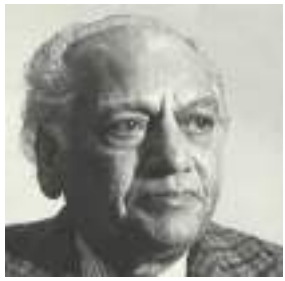
● फैज अहेमद फैज ●

प्रत्येक साहित्यकार कुनै न कुनै रूपमा समाजको एक एकाइ हुन्छ । साहित्यकारको आफ्नो समाजसित दुई किसिमको सम्बन्ध हुन्छ । एउटा व्यक्तिगत सम्बन्ध र दोस्रो साहित्यकारको सम्बन्ध । यी दुई सम्बन्धले साहित्यकारमा दोहोरो जिम्मेवारी सिर्जना गर्छ । एउटा सामान्य जिम्मेवारी, जुन कुनै समाजको सबै व्यक्ति या कुनै देशको नागरिकहरूका निमित्त एकैप्रकारको हुन्छ । दोस्रो विशेष जिम्मेवारी, जुन साहित्यकारहरूको आफ्नो कला या पेशासित जोडिएको हुन्छ । यी दुई सम्बन्ध र यसबाट उत्पन्न हुने जिम्मेवारी एकआपसमा बेलाबेला होइनन्, बरु अन्तरसम्बन्धित हुन् ।