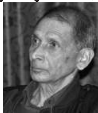
व्यवस्थालाई मानेर गएको हुनाले उनीहरू कम्युनिष्ट ... बाँकी ७ पेजमा

काठमाडौं । नेकपा (क्रान्तिकारी माओवादी)का महासचिव मोहन वैद्य किरणले नयाँ जनवादी क्रान्ति छोड्ने र संसदीय व्यवस्था मान्ने कम्युनिष्ट हुन नसक्ने बताउनु भएको छ । क्रान्तिकारी माओवादी निकट अखिल (क्रान्तिकारी) को केन्द्रीय समितिको सचिवालयको बैठकलाई सम्बोधन गर्दै महासचिव किरणले यस्तो बताउनु भएको हो । बैठकलाई सम्बोधन गर्दै महासचिव किरणले एमाले, माओवादी केन्द्र लगायतका पार्टीहरूले नयाँ जनवादी क्रान्ति परित्याग गर्दै संसदीय