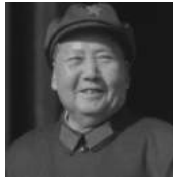
● माओत्सेतुड ●